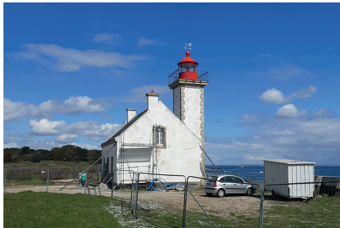
I AVANT - APRÈS