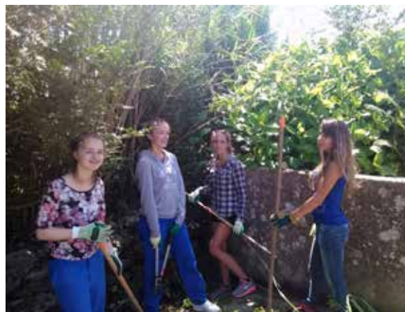
Chantier solidaire avec l'association Saint Gunthiern