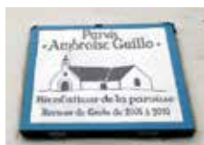
Plaque réalisée par Anne Le Hénaff, céramiste

chapelles du Mené, de Quelhuit, de Locmaria, de la Trinité. C'est ainsi qu'il a mobilisé plus de 406 000 € au lieu et place de la commune. Le parvis de l'église Saint-Tudy porte désormais son nom.