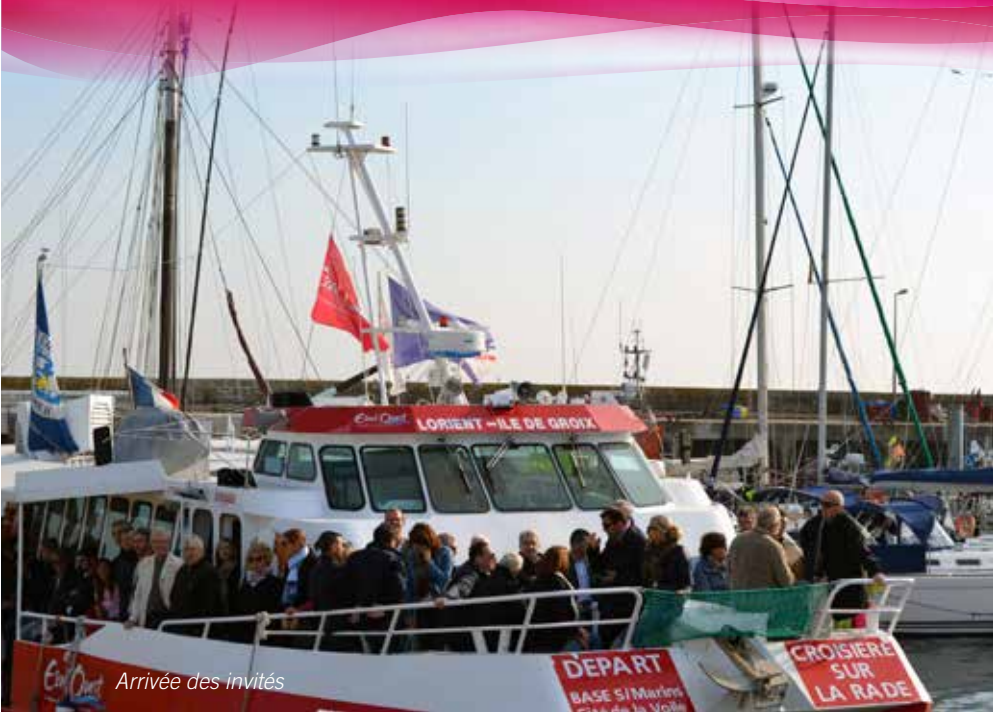
Arrivée des invités